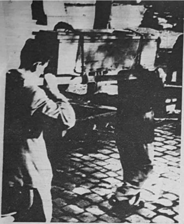
Habitantes de Talcahuano transportan al cementerio el cadáver de una víctima.