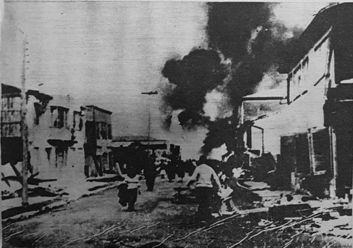
Vista de una de las calles de Castro, en Chile. Al fondo se ve un incendio. Hubo muchos destrozos.