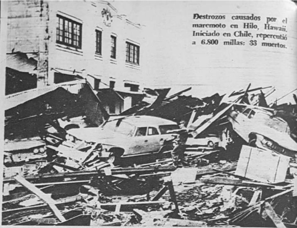
Destrozos causados por el maremoto en Hilo, Hawaii. Iniciado en Chile, repercutió a 6.800 millas: 33 muertos.