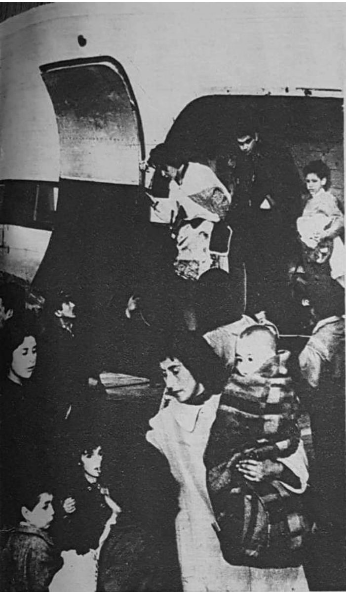
Mujeres y niños del sur chileno, que lograron salvarse de la destrucción y muerte, llegan a Santiago en aviones de carga. Sus hogares quedaron totalmente destruidos.