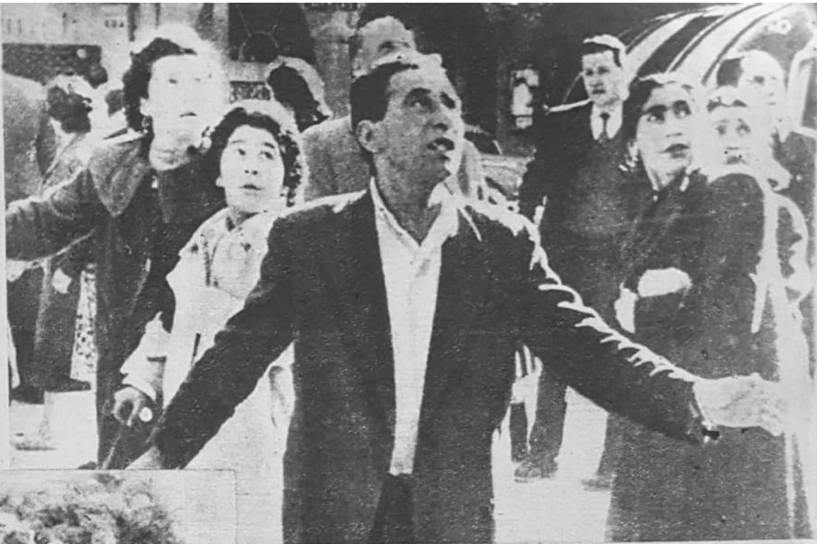
Con ojos horrorizados los habitantes de la castigada ciudad de Concepción observan cómo van derrumbándose los edificios ante el azote maléfico del terrible terremoto

Concepción, que es la tercera ciudad chilena en población con 220.000 habitantes y la segunda en el orden industrial, ha sufrido el embate de la catástrofe y más del 20 por ciento de la ciudad se encuentra en ruinas. La historia de Concepción está ligada a una fatalidad que arranca del 25 de mayo de 1751 en que fue destruida por un terremoto. La abnegación de sus habitantes concretó el milagro de rehacerla hasta que el 20 de febrero de 1835 otro terremoto destruyó sus edificios y