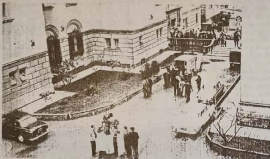
El asalto del Policlínico marcó, de hecho, el fin del grupo Tacuara de Baxter.

garlo, los dos últimos atentados atribuidos a sus simpatizantes incidió negativamente en la concreción de ese propósito. Quienes se favorecieron con este trágico táctico error fueron sus hábiles adversarios de izquierda, que además de la violencia saben utilizar un medio que Tacuara no posee: una serie de cooperativas de crédito que presta dinero a obreros, empleados y pequeños comerciantes; así logran alcanzar sus propósitos sin necesidad de recurrir a las pistolas o las cachiporras.