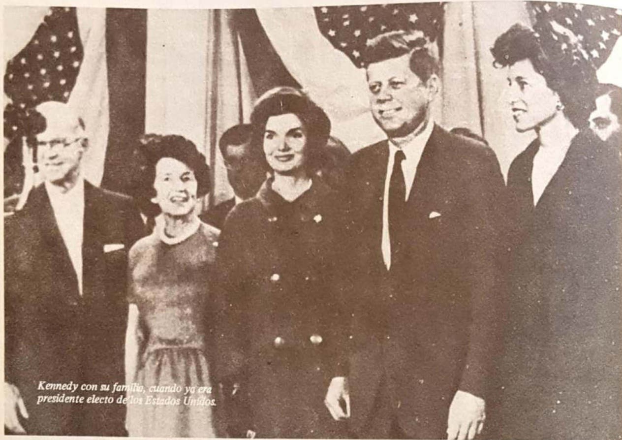
Kennedy con su familia, cuando ya era presidente electo de los Estados Unidos.