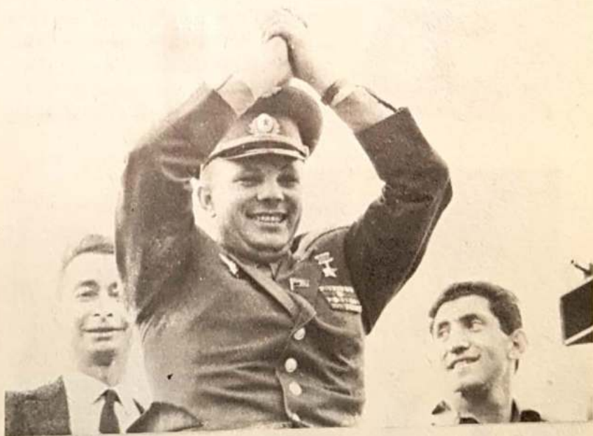
Yuri Gagarin, alza sus brazos, respondiendo al saludo de la multitud que lo ovaciona como a un héroe.

Entre los datos técnicos aportados en aquel entonces se consignó la resistencia del piloto que soportó, durante los 140 segundos de máxima aceleración, una presión de 6v, es decir, seis veces la fuerza de gravedad terrestre.