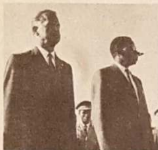
Dag Hammarskjöld, con el primer ministro del Congo, Cyrille Adoula, a poco de su arribo a Leopoldville.