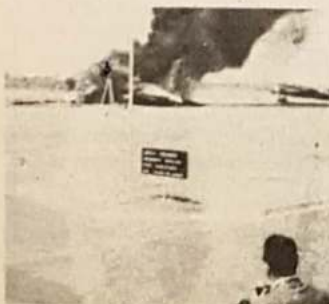
El accidente que costara la vida al secretario general de las Naciones Unidas Dag Hammarskjöld, en Katanga, cinco días después de la foto anterior.

Además, se aclaraba que el piloto soportó de manera satisfactoria el paso de la nave —de 4.725 kilogramos de peso— a su órbita, y si bien se conocía la hora del lanzamiento —3,7 hora argentina— y de su regreso —4,55 hora argentina— nada se sabía sobre el lugar de donde había partido ni el punto de descenso. Por el contrario, era notorio que el máximo líder soviético permanecía de vacaciones en Sochi, sobre el mar Negro, aunque se descontaba —tal como sucedió— que regresaría muy pronto a Moscú para una espectacular presentación en público con el flamante héroe del espacio.