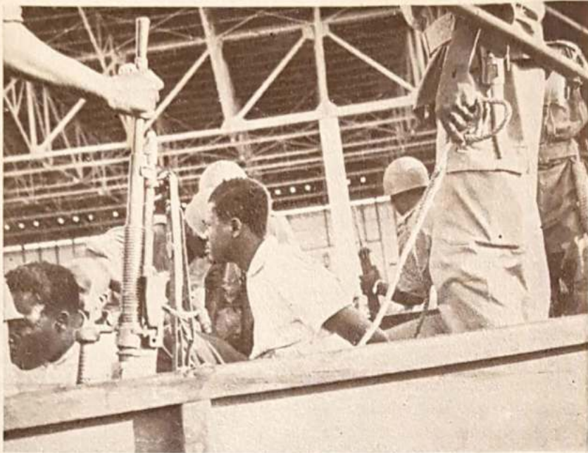
Patrice Lumumba, un líder nacionalista que sufriría un martirologio a manos de sus enemigos más acendrados; los cesecionistas de Katanga.