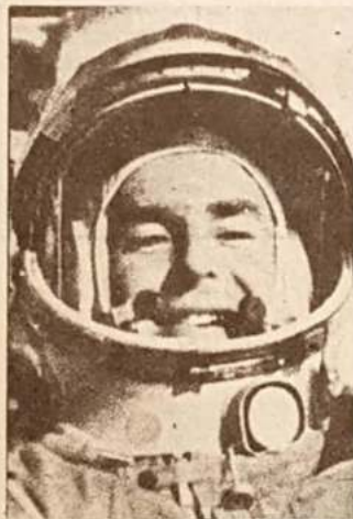
Alan B. Shepard, el primer astronauta de occidente en una de sus prácticas previas al lanzamiento desde Cabo Cañaveral.

asiático en el cual la guerra civil entre los seguidores de Suvanna Phuma, apoyado por el bloque soviético, y de otro príncipe, Bun Um, respaldado por occidente, y demás facciones tiende a prolongarse indefinidamente—, mientras que el resto del tiempo se dedicó a debatir los ensayos nucleares, el desarme y los problemas de Alemania. Precisamente sobre este último punto el secretario de Prensa de la Casa Blanca manifestaba que “la cuestión de Alemania incluirá el explosivo problema de Berlín occidental”. En obvia alusión a anteriores declaraciones de Kruschew sobre las eventuales medidas que podría adoptar la URSS para expulsar a británicos, franceses y norteamericanos de la ex capital alemana.