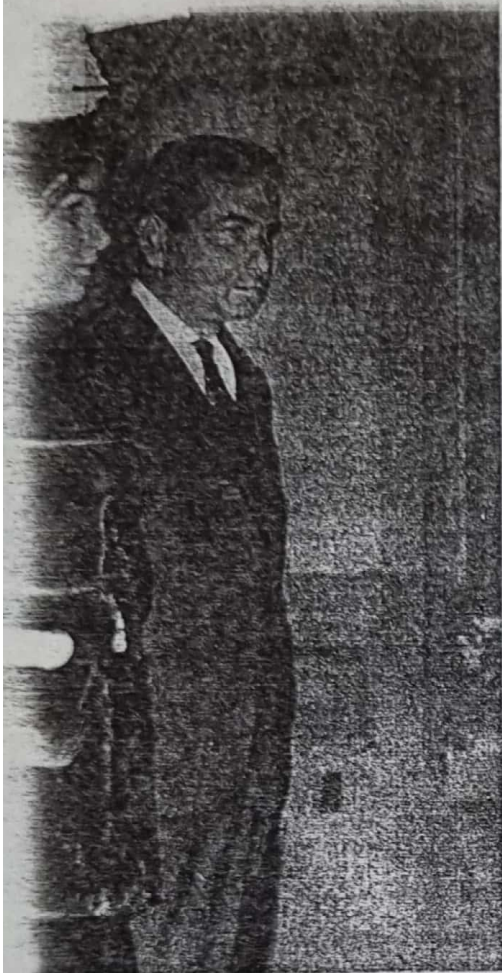
nan pagado los errores de su padre.

ejerciendo desde allí la presión necesaria para mantener un frente único y unido. Pero un calmo hitlerista confesó: "el desarraigo caíma. Además Estados Unidos no atacó a Rusia como esperábamós. La coexistencia actúa como la droga". Uno de los objetivos más importantes de ese frente es el de mantener relación solo con los grupos "nacionalistas" que acatan las normas que se les imparten. Simultáneamente se tiende a evitar por todos los medios que la colonia alemana en nuestro país tenga vinculación alguna con ciudadanos argentinos, a los cuales, aún hoy, se los llama como en 1946: hiesige (salvaje, indio). A partir de ese año y como consecuencia de la gran afluencia al país de refugiados nazis se fueron formando círculos que contaron con el decidido apoyo monetario de acaudalados industriales y con el más franco apoyo de funcionarios argentinos.