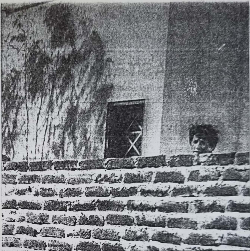
La esposa de Adolf Eichman vive escondiéndose e insulta a los fotógrafos.