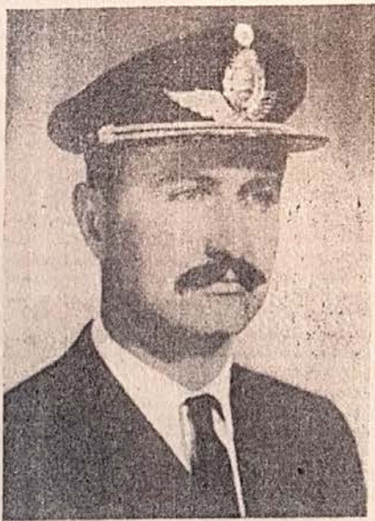
Comodoro Agustín H. de la Vega, Jefe Nacional

Porque somos cabalmente justos, aquí no vamos a escatimar una pizca de verdad; mucho se ha dicho de la subversión realizada durante el peronismo, y qué decir de la provocada luego de la Revo-