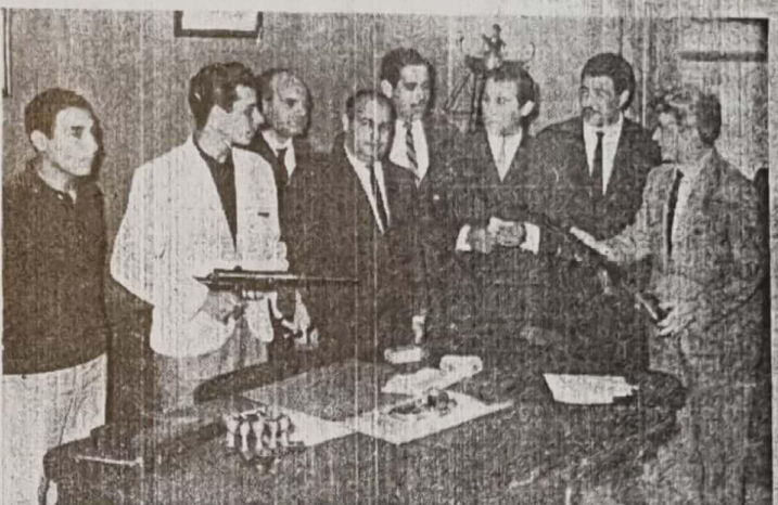
ESTOS SON ALGUNAS de las armas y miras telescópicas, dinero y otros objetos secuestrados en los domicilios de los implicados en el vandálico asalto al Policlínico Bancario.