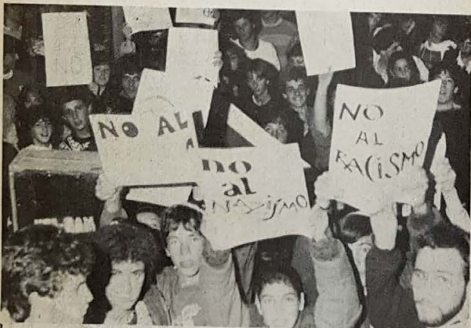
La juventud judía se hizo presente —luego de una marcha de antorchas por calles aledañas— con sus cantos, sus carteles y consignas.

"Esto no tardó en manifestarse a través de la utilización para la exacerbación de la fobia antijudía, de distintas concentraciones públicas programadas para una variedad de finalidades. En una palabra: para la ejecución de "excesos", excesos antisemitas. Con todas las implicancias que el vocablo encierra. Excesos que tuvieron su consagración televisiva en el acto de la C.G.T. de la Avenida 9 de Julio; que posteriormente desfilaron su virulencia en un acto conmemorativo de la gesta de las Malvinas; y que se repitieron en el acto de protesta frente a la embajada de