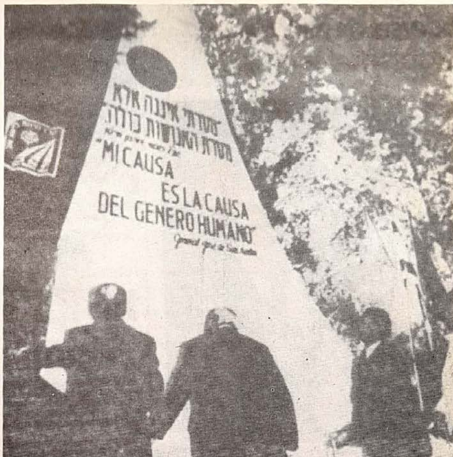
Momento en que en Israel, en un monte cercano a Jerusalem los miembros de la comitiva, descubren el monumento al General José de San Martín.

"Se eruirá en las puertas del Oriente como un testimonio de amor entre dos pueblos hermanos. Y allí, a la sombra de su bosque, al pie de la flecha que señala el cielo, podrán reunirse los argentinos que han venido a vivir en su tierra destinada y sus hijos, a quienes podrán enseñar con nostalgia y con amor que allá lejos, muy lejos, una tierra grande y generosa un día les ofreció a sus abuelos, paz, trabajo y libertad".