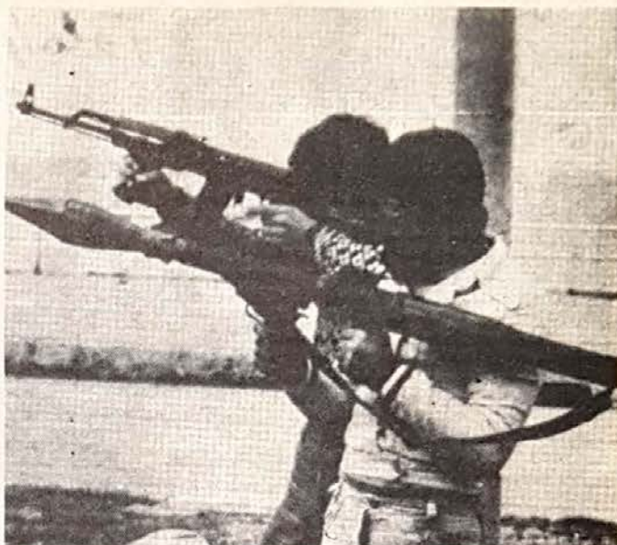
El extremismo terrorista y su cruel actitud ante los civiles judíos en Líbano.

Ante inequívoca voluntad del grupo terrorista shiita de Beirut de seguir adelante con sus criminales designios de