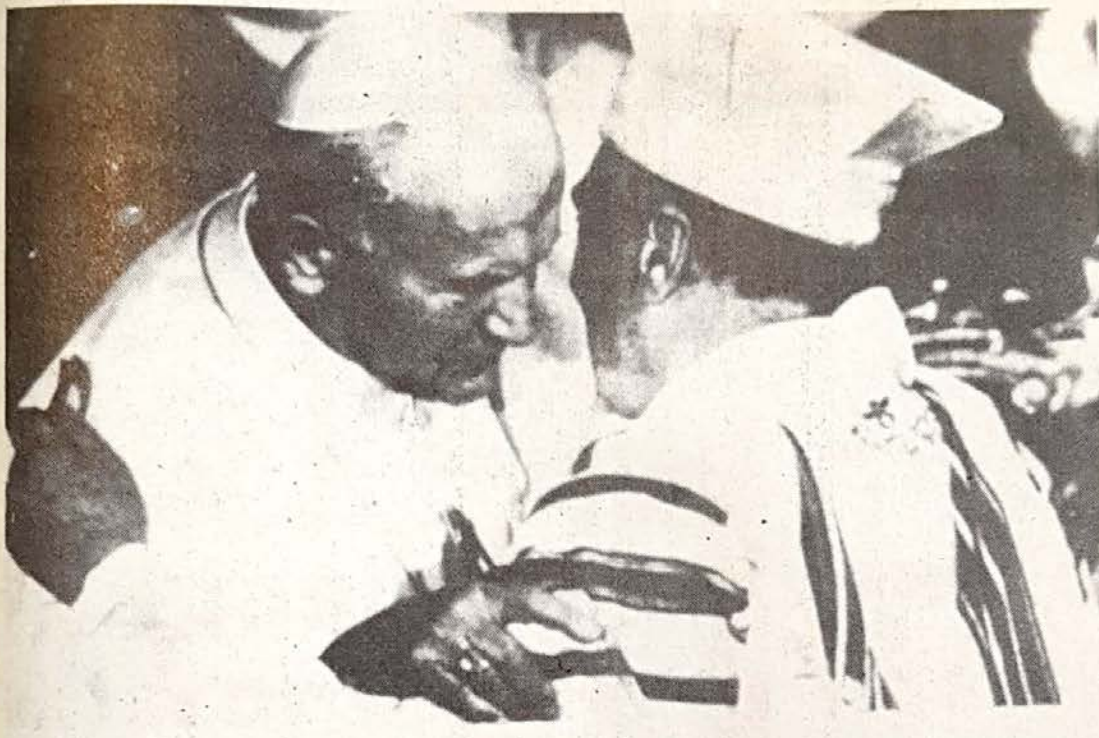
El Papa Juan Pablo II y el Gran Rabino Elio Toaff se saludan momentos antes de hacer su entrada a la Sinagoga de Roma.

también de los cristianos y del cristianismo, y esto a cualquier nivel de mentalidad, de enseñanza y de comunicación.