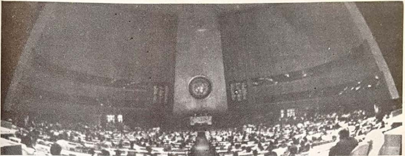
Las Naciones Unidas deben derogar la arbitraria resolución "sionismo-racismo" y todas las demás condenas arbitrarias contra Israel, para afianzar realmente el proceso de paz y libertad en el mundo.

En estos días se celebra el 40º aniversario de la fundación de las Naciones Unidas. Surgido el organismo internacional sobre las ruinas humeantes de la más horrenda conflagración sufrida en toda la historia de luchas y enconos, los fundadores de la U.N. abrigaron el noble propósito de echar los cimientos para un mundo signado por la convivencia y el respeto de todos los pueblos y hombres de la tierra, sin discriminaciones ni opresiones de ninguna índole.