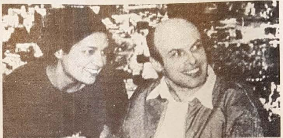
Anatoly Scharansky y su esposa, en Israel, reflejan en sus rostros la alegría del reencuentro.

La historia de los pueblos se nutre con las de las individualidades que por obra del destino se convierten en símbolo y bandera. Es el caso de Scharansky, quien vio segados preciosos años de su vida, en una celda, en defensa de un ideal, pero en