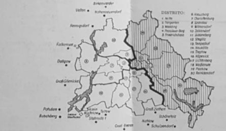
Según los Acuerdos sobre el estatuto de las cuatro potencias aliadas: - Los Soviets 4 millones con 238 km 2 y 110 millones de habitantes - Los Estados Unidos 4 millones con 255 km 2 y 120 millones de habitantes - Gran Bretaña 4 millones con 145 km 2 y 60 millones de habitantes - Francia 7 millones con 104 km 2 y 54 millones de habitantes. En total corresponden a las tres potencias occidentales 12 distritos de Berlín con 124 km 2 y 21 millones de habitantes.