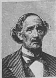
Bartolomé Mitre, contra sus ejércitos se enfrenaría el bravo Varela.-

Entre los diversos capítulos de la cruenta lucha civil argentina, evidentemente Varela ocupa lugar de privilegio. Es por eso, que hoy destacamos su figura, ya que la misma es una de las más olvidadas, quizás injustamente, por que muy pocos lograron igualar en valor a ese "Quijote de los Andes", como lo llamara el Dr. José María Rosa.